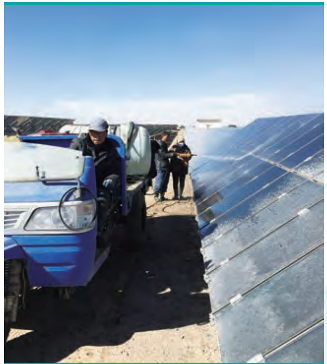
青海太陽能發電場正在清潔組件