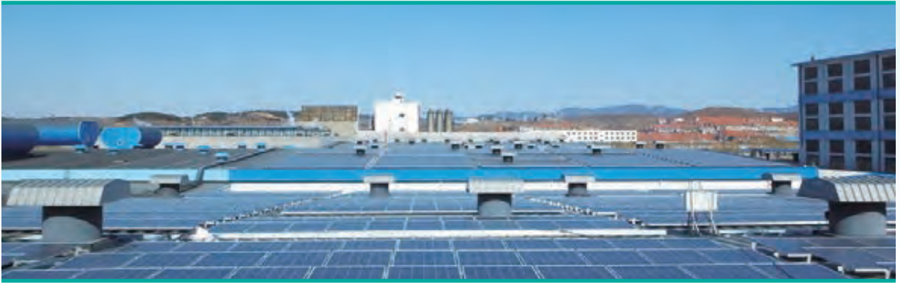
榮成分布式光伏電站的一部分

在扶助環境下，本集團將加強於太陽能發電之投資，尤其是山東及江蘇省等東部發達地區之分布式太陽能發電。管理層相信，二零一五年公司太陽能項目裝機將顯著增長。