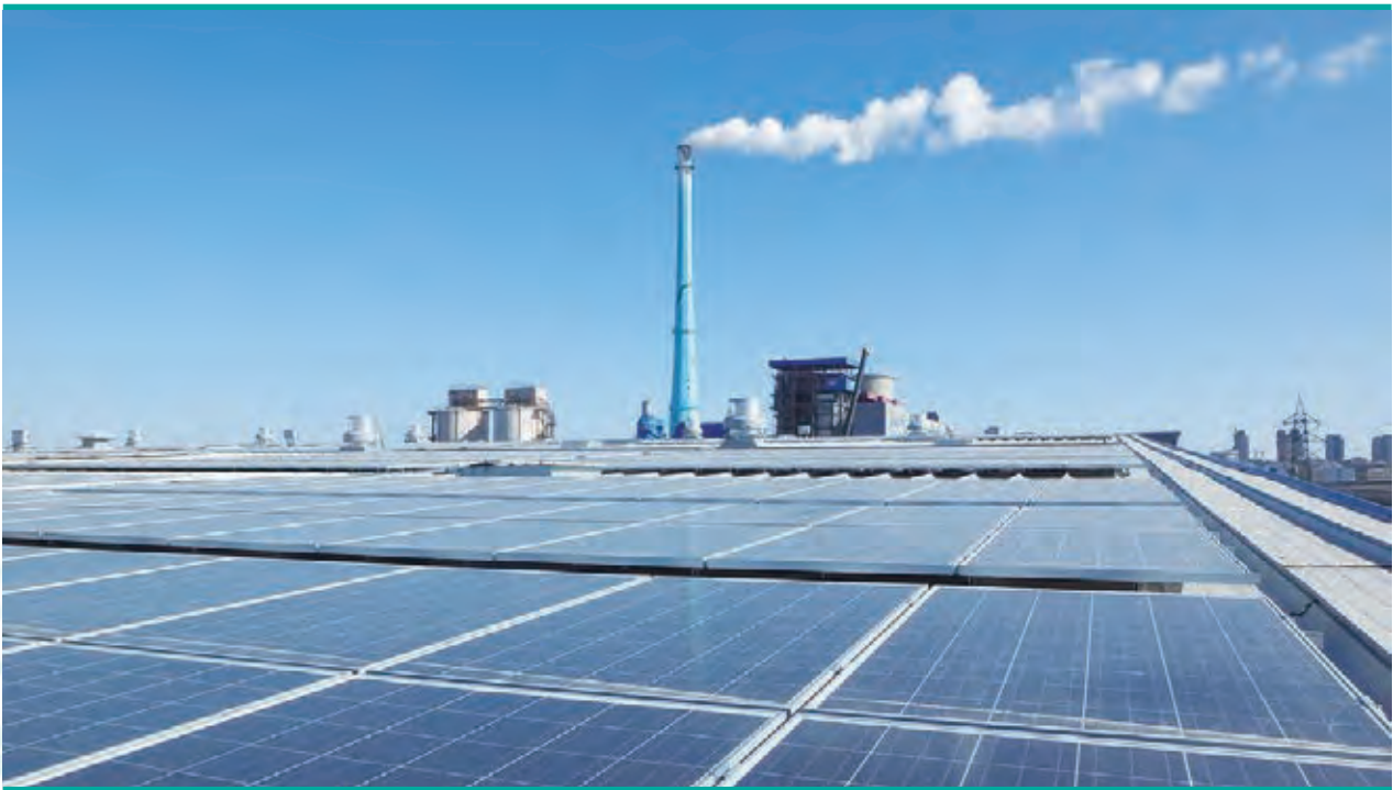
榮成分布式太陽能電站開始發電